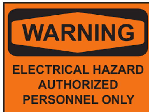
図1 警告ラベル- 電氣的危険