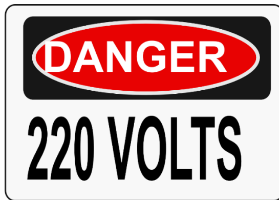
図2 危険ラベル- 電氣的危険